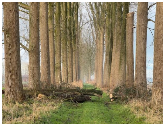
Boom gesneuveld in de Ziedelingen