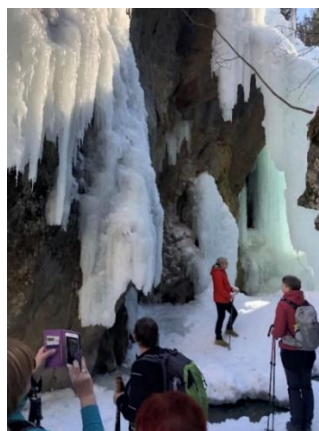
Zicht vanuit de kamer in Arzl Spectaculaire ijsvormen in Plangaross

De volgende dag was het tijd om te leren lopen met sneeuwschoenen. Het was even wennen aan die rare dingen onder de voeten, maar na wat oefenen viel het best mee. We wandelden in het natuurgebied van de Piller Höhe , een prachtige hoogvlakte op 1600 m hoogte, waar volgens de gids nog beren vrij in de natuur leven (gelukkig in hun winterslaap). Hier was het aangeraden in de voetsporen van uw voorganger te blijven om niet tot uw middel vast te zitten in de sneeuw. Daar zijn sommigen niet aan ontsnapt.