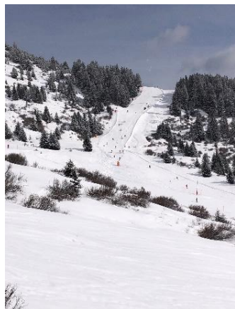
Zicht op de skipistes