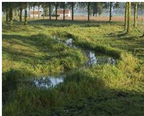
Natuurgebied Eeklose Watergang