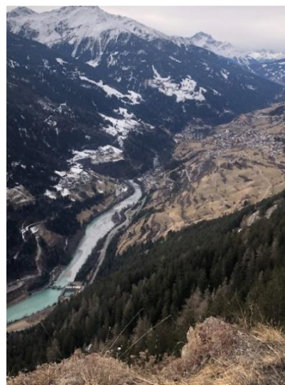
Panorama van het Imst dal

's Anderdaags werd een klimdag in Hoog Imst. De groep Corry deed een deel met de gondels en aansluitend een klim van 300 hoogtemeters langs de skipistes tot de Taschach alm.