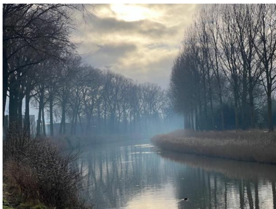
Schipdonkkanaal in de ochtendschemering

Ondanks wat kleine valpartijtjes heeft niemand zich serieus bezeerd, gelukkig maar. De deelnemers zagen de uitzonderlijke omstandigheden eerder als een uitdaging en bleken toch heel tevreden van het aangeboden parcours.