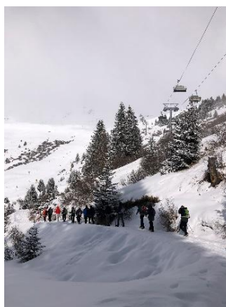
Rondweg in Fiss

De laatste wandeldag was zonder de ingehuurd gidsen en volledig door Cees en Corry uitgepuzzeld in het prachtige, mondaine Seefeld. Corry's groep ging eerst shoppen in Seefeld om vervolgens met de koets naar de bekende Wildmoos alm te trekken. De groep van Cees deed het ganse traject alweer wandelend. Seefeld is een prachtige winterbestemming gekend van Olympische winterspelen en wereldbikers van zowat elke wintersportdiscipline. De wandeling ging langs springschansen, langlaufpistes, biatlon- en skipistes. Na de rustpost werd langs de "Friedenwanderweg" terug gewandeld naar het skicentrum.