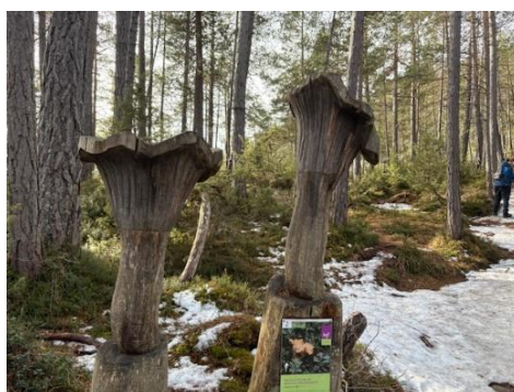
Houtsnijwerk midden in het bos

De groep van Cees deed de 600 hoogtemeters volledig te voet, langs een bospad met prachtige uitbeeldingen in houtsnijwerk en dan langs het skistation tot aan de zelfde alm als de andere groep.