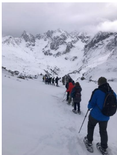
Wandelen op de Hochzeiger

De volgende dag deden we de Höchzeiger aan. Met de gondels werden we naar het tussenstation gebracht waar we overstapten in de stoeltjeslift die ons naar 2480m zou brengen midden een flinke sneeuwbuï. Boven gekomen werden weer de sneeuwschoenen aangetrokken. De oefening van de vorige dag kwam goed van pas. We maakten een oversteek door hoge sneeuw naar de Sechzeiger en het skistation Zirbenbahn op 2400m. Daar starten we onze wandeling terug naar het tussenstation. De zon kwam nu en dan eens piepen en zorgde voor een formidabel lichtspel op de sneeuwtoppen en prachtige panorama's in het diepe dal. We daalden af langs de skipistes. Nu en dan moesten we zo'n piste oversteken, wat een niet vanzelfsprekende oefening was.