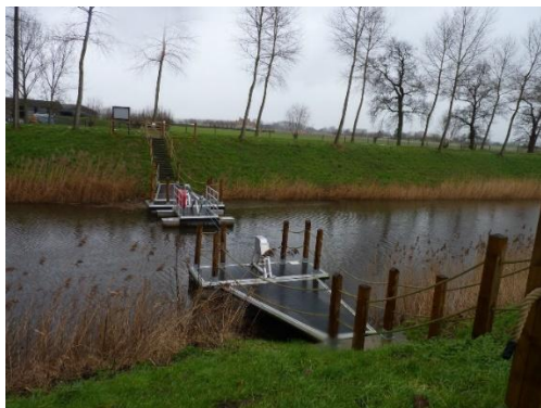
Voetveer over het Leopoldkanaal