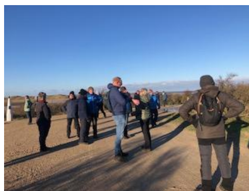
Wandelen door de duinen