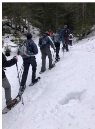
Met sneeuwschoenen op de Höhe Piller