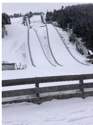
Skischansen in Seefeld

De laatste wandeldag was zonder de ingehuurd gidsen en volledig door Cees en Corry uitgepuzzeld in het prachtige, mondaine Seefeld. Corry's groep ging eerst shoppen in Seefeld om vervolgens met de koets naar de bekende Wildmoos alm te trekken. De groep van Cees deed het ganse traject alweer wandelend. Seefeld is een prachtige winterbestemming gekend van Olympische winterspelen en wereldbikers van zowat elke wintersportdiscipline. De wandeling ging langs springschansen, langlaufpistes, biatlon- en skipistes. Na de rustpost werd langs de "Friedenwanderweg" terug gewandeld naar het skicentrum.